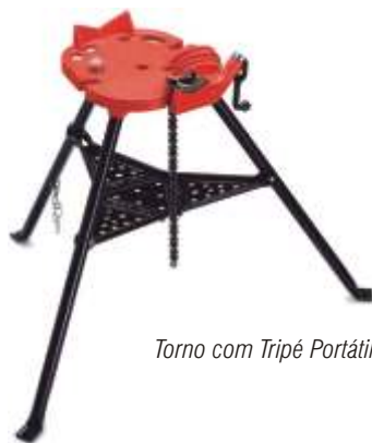
Torno com Tripé Portátil 460