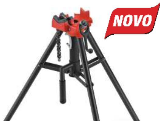
Torno de Corrente Portátil 425