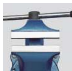
Os mordentes maiores permitem uma superfície de ajuste mais ampla.

Os tornos da série F são construídos em aço forjado para resistirem à uma força de 75.000 PSI. Estes tornos resistentes e robustos superam em desempenho os outros tornos de bancada existentes no mercado.