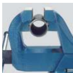
Os mordentes para tubos de grandes capacidades para prendê-los com segurança