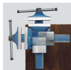
Base Giratória de Ajuste infinito, permite que o torno se feche com segurança em qualquer posição