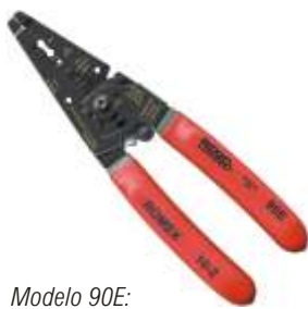
Modelo 90E: Cortador/Descascador