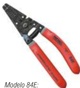
Modelo 84E: Cortador/Descascador