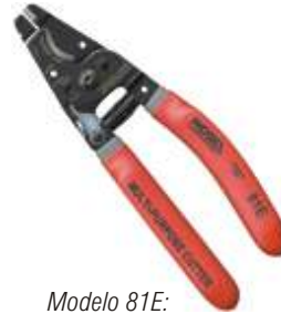
Modelo 81E: Cortador multi-uso