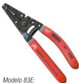
Modelo 83E: Cortador/Descascador