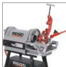
Rosqueadeira Página 4.12