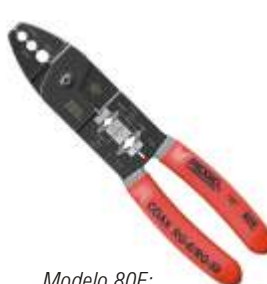
Modelo 80E: Cortador