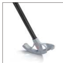
Curvador de Conduíte Página 6.3