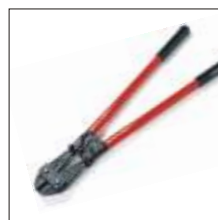
Cortavergalhão Página 5.5