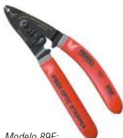
Modelo 89E: Descascador de fibra ótica