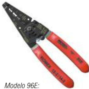
Modelo 96E: Cortador/Descascador