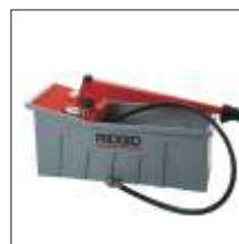
Caixa de Ensaio Página 7.3