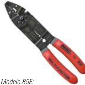
Modelo 85E: Com prensa terminal frontal