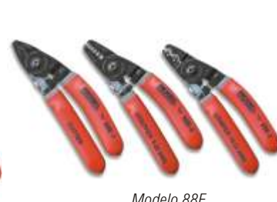
Modelo 88E 3 Mini alicates para espaços reduzidos