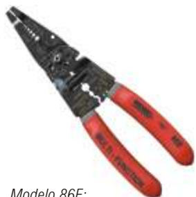
Modelo 86E: Com prensa terminal pivot traseiro