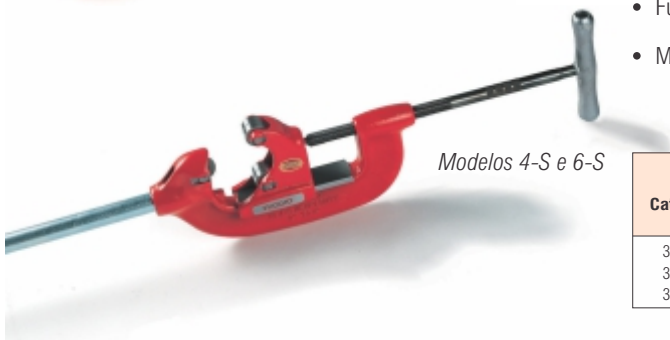
Modelos 4-S e 6-S