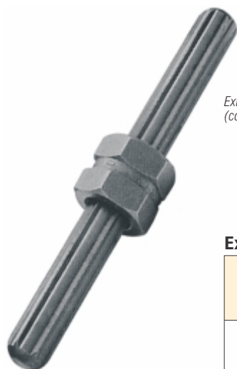
Extrator de parafuso (com deslizador de porca)