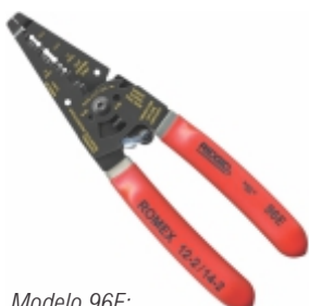
Modelo 96E: Cortador/Descascador