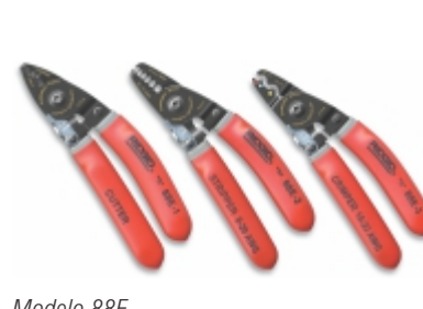
Modelo 88E 3 Mini alicates para espaços reduzidos