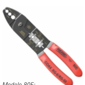
Modelo 80E: Cortador