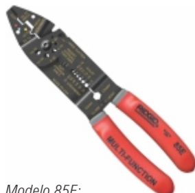
Modelo 85E: Com prensa terminal frontal