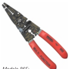
Modelo 86E: Com prensa terminal pivot traseiro