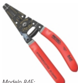
Modelo 84E: Cortador/Descascador