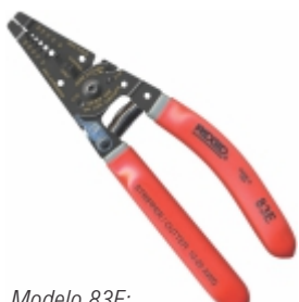
Modelo 83E: Cortador/Descascador