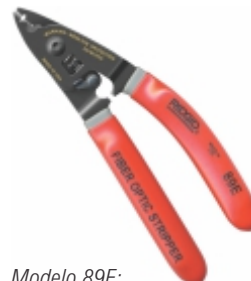
Modelo 89E: Descascador de fibra ótica