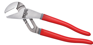
Alicate Bomba D'água Catálogo Nos. 62347, 62352, 16473, 62362