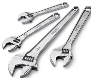
Chave Ajustável Catálogo Nos. 86902, 86907, 86912, 86917, 86922, 86927, 86932