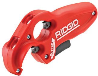
PTEC 3000 Catálogo No. 41608