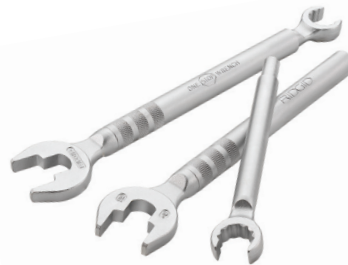
Chave One Stop Catálogo No. 27023