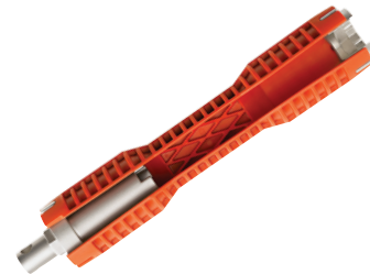
Chave de Torneira Catálogo No. 57003