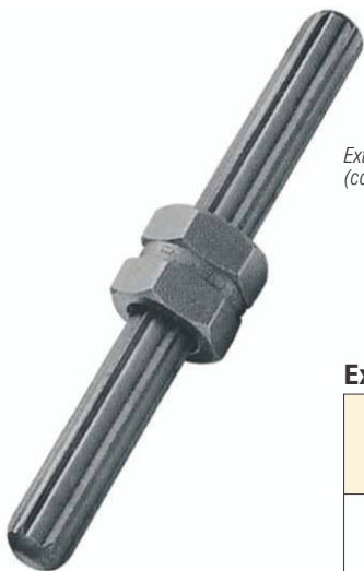
Extrator de parafuso (com deslizador de porca)