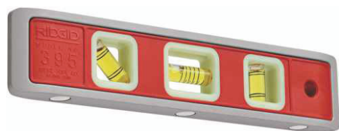
Nível Mod. 395